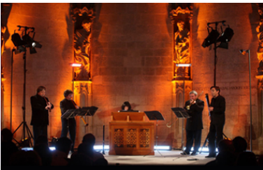
Restauración del pórtico y nuevos usos. "Concierto de Marlango"

A finales del siglo XX comenzó una nueva fase en la evolución de la Catedral de Santa María. Corría el año 1994 cuando el equilibrio estructural que sustenta a la catedral daba muestras de inestabilidad, una vez más. Es entonces cuando se inicia un proceso de reflexión y estudio que culminó con la realización del Plan Director de Restauración Integral de la Catedral de Santa María. Dicho Plan Director apuntaba a que la restauración del monumento debería desarrollarse en dos direcciones, hacia la materialidad del monumento y hacia el exterior en su relación con su entorno físico, urbano y socio-cultural.