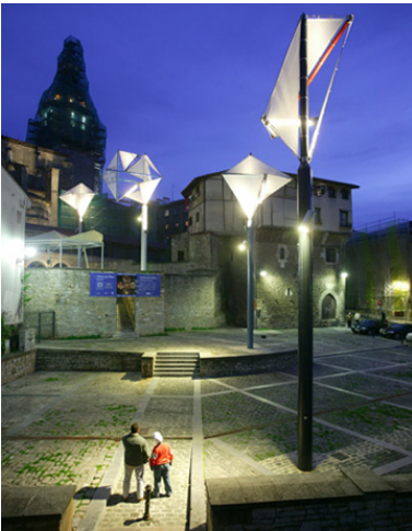
Iluminación del entorno de la catedral. Recuperación activa de la plaza de las Burullerías.

Con el objetivo de gestionar este proyecto se crea a finales de 1999 la Fundación Catedral Santa María. La Fundación viene desarrollando desde entonces una multitud de actuaciones para conseguir los objetivos propuestos. Esta página web es buen ejemplo de ello y el visitante puede conocer desde aquí la restauración del siglo XXI de la Catedral de Santa María de Vitoria-Gasteiz.