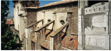
Foto Izquierda: Cuando se sustituyen las bóvedas de madera por las de piedra, fue necesaria la introducción de contrafuertes para contrarrestar los empujes. En la fotografía, vista de los contrafuertes de la nave meridional. Foto Derecha: Sepulcro de don Martín Saez de Salinas, construido durante el siglo XVI y posteriormente trasladado hasta su actual ubicación.