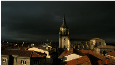
Vista de la Catedral desde el sur del Casco Antiguo de Vitoria-Gasteiz.