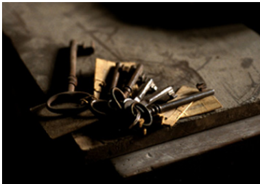
Llaves de puertas de iglesia sobre la escalera de madera que sube a la torre.