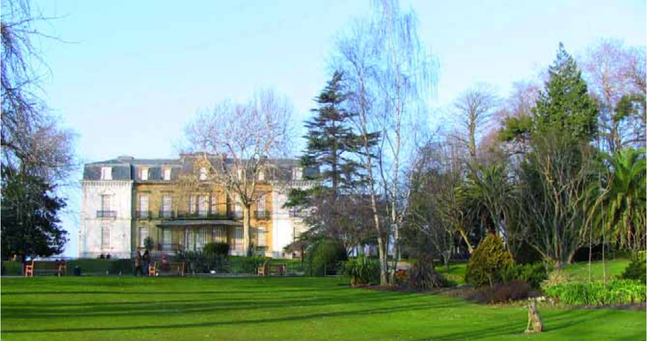
Palacio y jardín de Ayete.

Además de en la Ley de Patrimonio Histórico Español, en las leyes de las comunidades autónomas de Andalucía, Cataluña, Valencia, Madrid, Baleares, Aragón, Canarias, Extremadura, Asturias, Castilla y León, y Navarra, los jardines históricos también son clasificados como Bienes de Interés Cultural, en un apartado específico titulado Jardines Históricos. 5