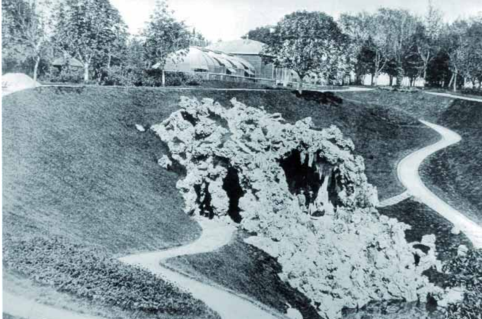
La gruta y el invernáculo.

que no parece, ya que ha introducido en el decreto un artículo el nº 18 que, da facilidades para otras intervenciones, se dará la insólita circunstancia de que, un jardín histórico tan significativo y recientemente declarado Conjunto Monumental, va a albergar una construcción soterrada a modo de bunker, ajena totalmente al espíritu y a la poética de un jardín paisajista del siglo XIX, convirtiéndose el jardín en un mero solar inmobiliario, o en un simple espacio verde donde construir.